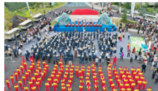
开放仪式现场

去年9月,全省加快水利基础设施建设暨“水利+”现场会议在定海区举行。作为浙江省水利工程建设经典案例,“五山水利工程”别开生面向全省呈现了定海的“共富”新思路。