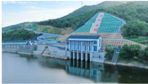
五山水利“西调”工程

定海地处亚热带海洋性季风气候带,城市三面环山,一面临海,长期饱受台汛之苦。2019年,定海区下定决心全面部署实施五山水利工程(东海云廊生态带)建设项目,实施五山水利“上拦”“西调”“中提升”“内循环”4大工程。