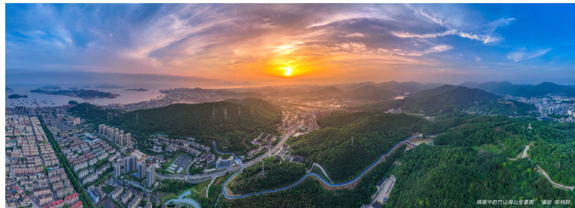
晚霞中的竹山海山全景图

5月27日,定海中心城区的全域景区化建设迎来高光时刻:总长25公里,美丽磅礴的东海云廊全线对外开放。一条穿越东山、长岗山、擂鼓山、海山和竹山的生态绿道以及在五山间架设的一座座城市飘带桥,组成了定海新的旅游地标,正式宣告古城旅游迎来东海云廊时代。