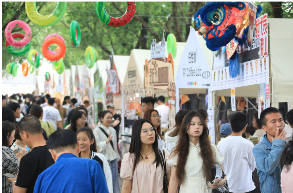
活动现场游客络绎不绝