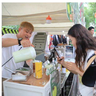
店主正在为游客制作咖啡