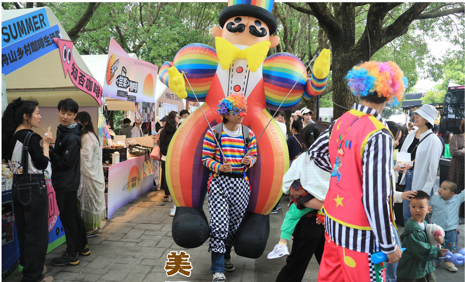
人偶吸引了现场游客的目光