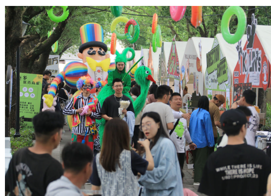
一支人偶队伍路过集市