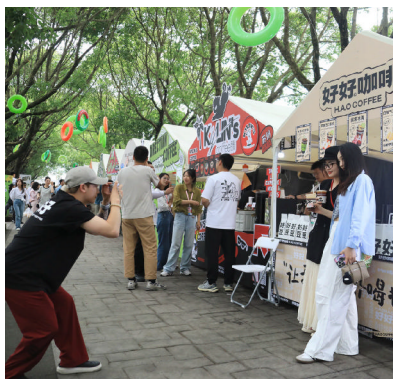
一名咖啡摊主正在为两名顾客拍照