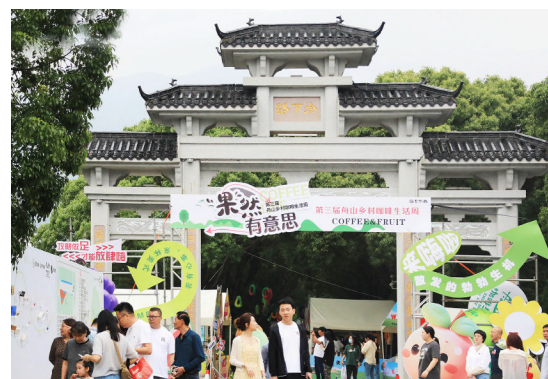
6月1日，第三届舟山乡村咖啡生活周在普陀区展茅街道徐火路火热举行